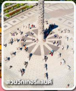
สวนจึกเกอร์แลนด์