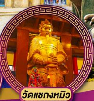
วัดชองก๊วย