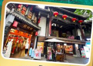
ถนนโบราณจีนหลี่