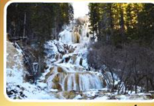
อุทยานโหมวหนีโกว