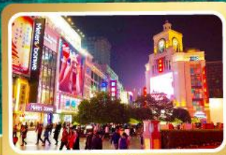
ช้อปปิ้งถนนชุนชิว