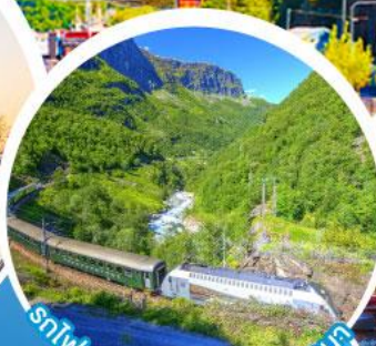
รถไฟสายโรแมนติกฟลัมสบานา