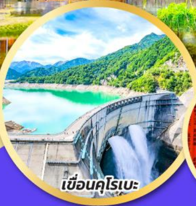
เขื่อนคุโรเบะ