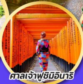
ศาลเจ้าฟุชิมิอินาริ