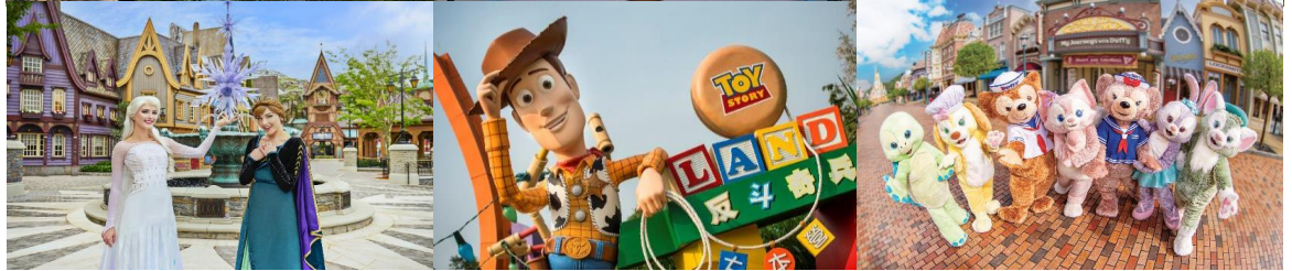
Option: Disneyland (ไม่รวมค่าเดินทาง)