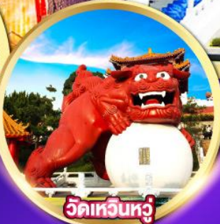
วัดเหวินหู่