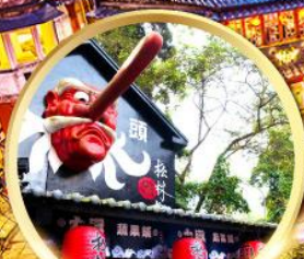
หมู่บ้านปศางซีโกว