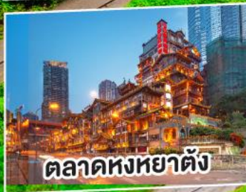
ตลาดหงหยาดัง

ไม่ลงร้านช้อปปิ้ง / เมนูพิเศษ สุกี้หม้อไฟ