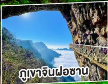
ภูเขาจินฝอซาน