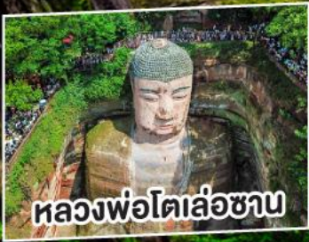
หลวงพ่อโตเล่อซาน