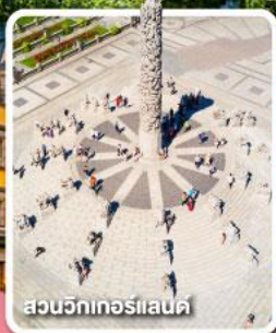
สวนจันทน์โรแลนด์