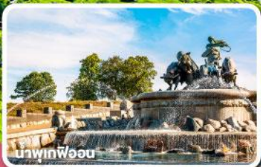
น้ำพุร้อน