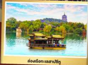
ล่องเรือทะเลสาปซีหู