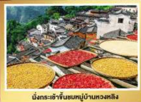
เมืองโบราณหมู่บ้านหวงหลิง