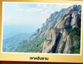
เขาหลงซาน