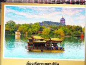
ล่องเรือทะเลสาปซีหู