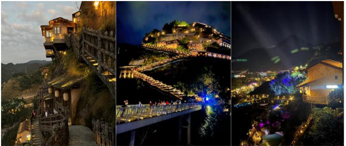
ที่พัก Shangrao Grandhouse Hotel หรือเทียบเท่า 5 ดาว (มาตรฐานจีน)