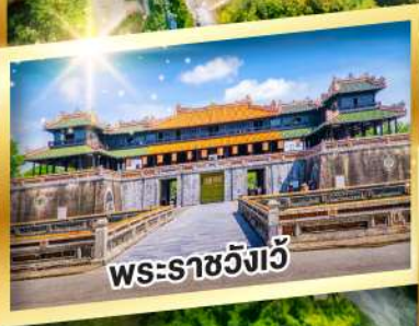
พระราชวังเว้