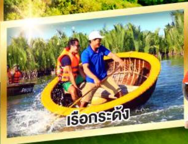
เรือกระดิ่ง