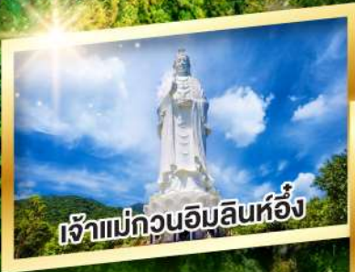
เจ้าแม่กวนอิมลินห์ฮิ่ง