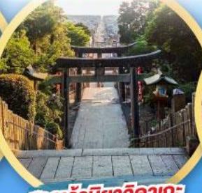
ศาลเจ้ามียาจิดากะ