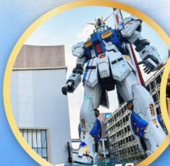
กันดั้ม ปาร์ค ฟุกุโอกะ