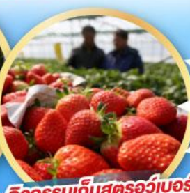
กิจกรรมเก็บสตอว์เบอร์รี่