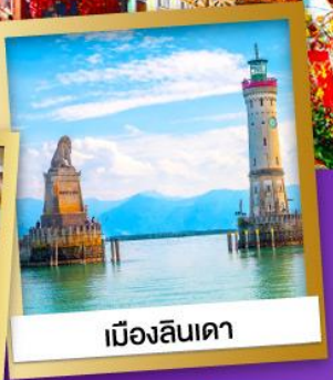
เมืองลินเดา