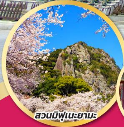
สวนมิฟูเนะยามะ