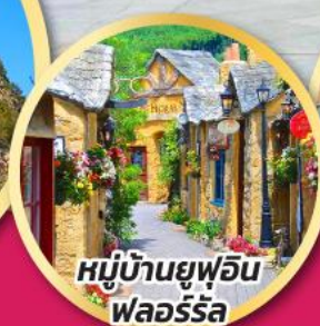
หมู่บ้านยูฟูอิน ฟลอร์ริล