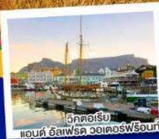
วิกตอเรีย แอนต์ อัลเฟรด วอเตอร์ฟร้อนท์

10-17 ก.ย. 67 29 ต.ค.-05 พ.ย. 67 12-19 พ.ย. 67 26 พ.ย.- 03 ส.ค. 67