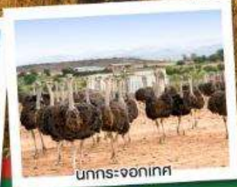
นกกระจอกเทศ