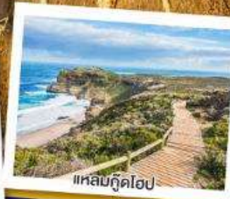
แหลมกู๊ดโฮป