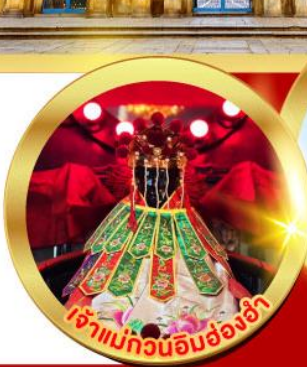
เจ้าแม่ทวนอิมฮ่องฮ่า