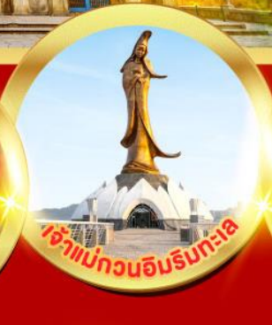
เจ้าแม่ทวนอิมริมทะเล