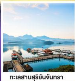
ทะเลสาบสุริยอินจันตรา