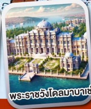
พระราชวังโดลมาบาเช่