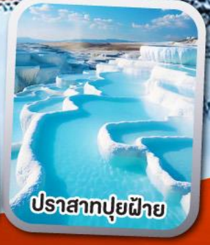
ปราสาทปุยฝ้าย