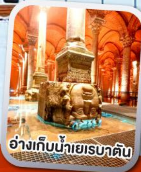
อ่างเก็บน้ำเยเรบาตัน