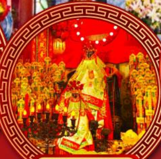
วัดเจ้าแม่กวนอิม ฮ่องฮ่า