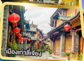
เมืองก่าลี่เจียง