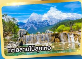
ทะเลสาบปี่สุยเหอ