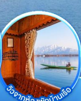
วิวจากห้องพักบ้านเรือ