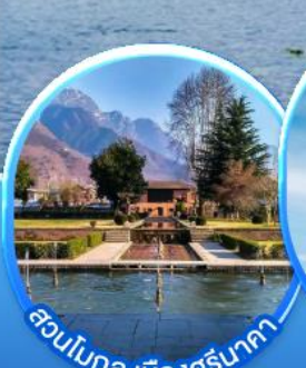
สวนโมกุล เมืองศรีนาคา