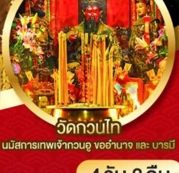
วัดกวนไท่

นมัสการองค์เจ้าแม่กวนอิม อายุกว่า 600 ปี