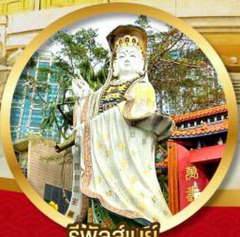
รีพลัสเบย์