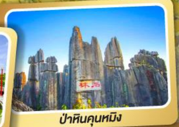
ป่าหินคุณหมิง