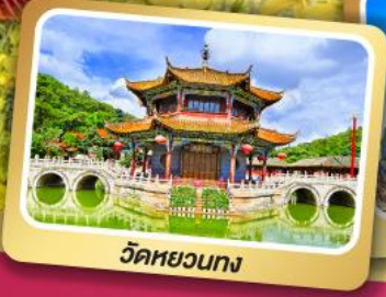
วัดหอนกง