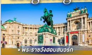
• พระราชวังฮอสมบวร์ก

นั่งกระเช้าลอยฟ้า สู่ยอดเขาจุงเฟรา พร้อมนั่งรถไฟลงจากเขาม วิวสองข้างทาง