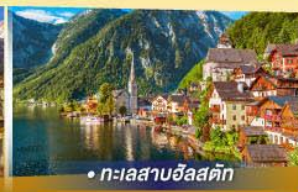
• ทะเลสาบฮิลสติก