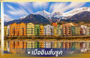
• เมืองอินส์บรุค