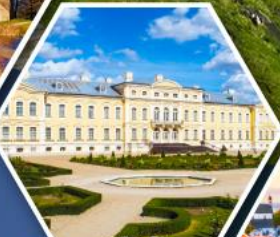
พระราชวังรินดาเล