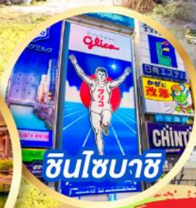
ซินโซบาชิ