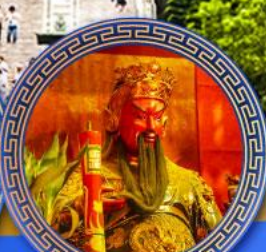
วัดกวนโถ