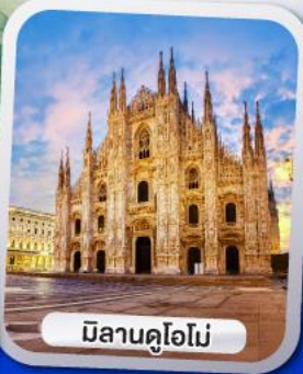
มิลานคูโอโม