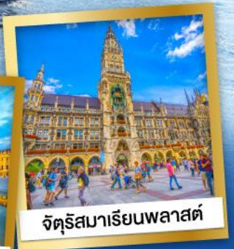
จัตุรัสมาเรียนพลาสต์