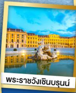
พระราชวังเซ็นบรุนน์