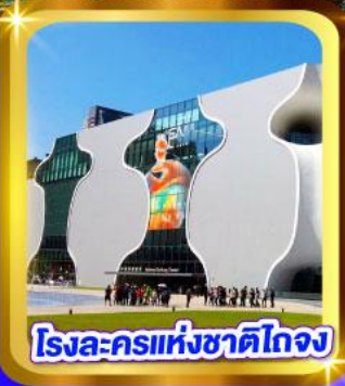
โรงละครแห่งชาติไทจง