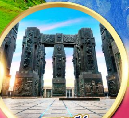
อนุสาวรีย์ ประวัติศาสตร์จอร์เจีย