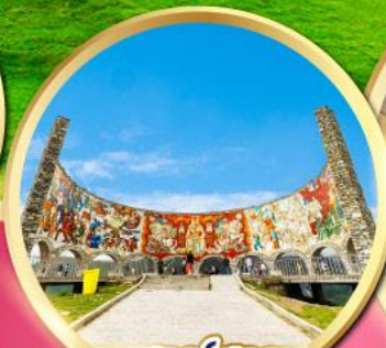
อนุสรณ์สถาน รัสเซีย-จอร์เจีย