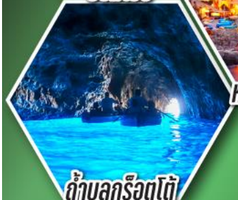
ถ้ำลูกรोटโต้