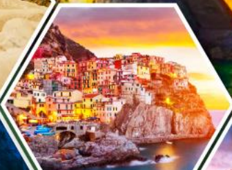
หมู่บ้านมาราโรลา