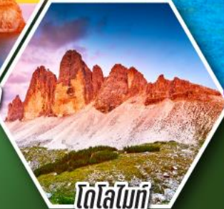
โดโลไมท์

โปรแกรมเดี่ยว เก็บครบรอบ อิตาลี ตั้งแต่เหนือถึงใต้