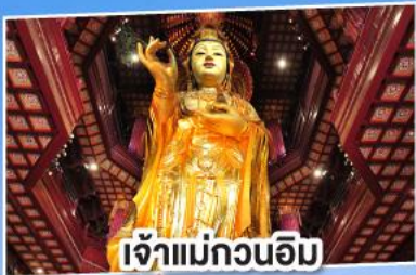
เจ้าแม่กวนอิม