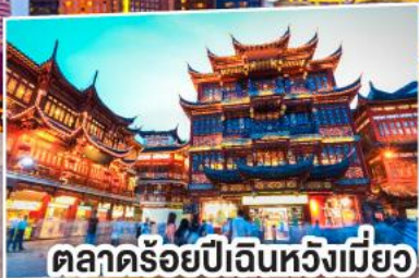
ตลาดร้อยปีเดินหวังเหมียว