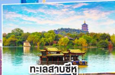
ทะเลสาบซีหู