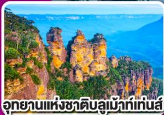
อุทยานแห่งชาติบลูเมาท์เทนส์

พิเศษ เมนูกึ่งคิอบส์เตอร์กำหนด 1 ตัว พร้อมไวน์ชั้นเยี่ยม