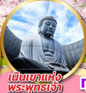
เนินเขาแห่ง พระพุทธรเจ้า