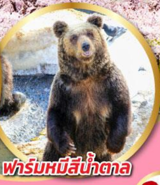
ฟาร์มหมีสีน้ำตาล