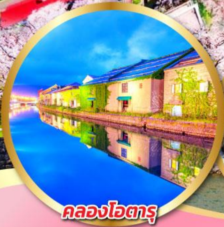
คลองโอดารุ