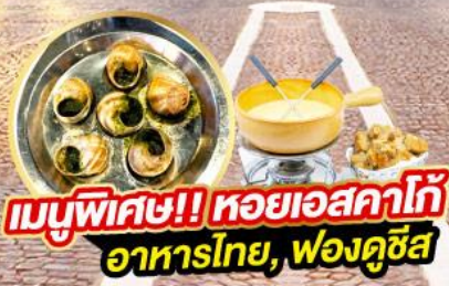
เมนูพิเศษ!! หอยเอสคาโก้ อาหารไทย, ฟองดูชีส