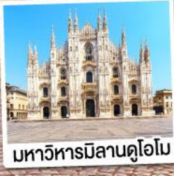
มหาวิหารมิลานดูโอโม