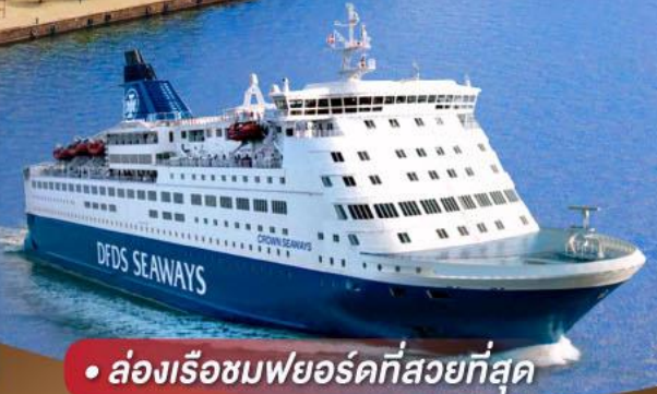
• ล่องเรือชมพยอร์ดที่สวยงามที่สุด