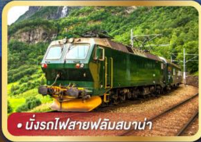
• นั้งรถไฟสายฟลัมสบาน่า