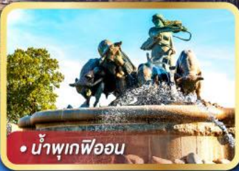
• น้ำพุเทพีออน