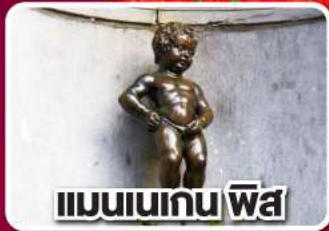
แมนเนเกน ฟิส