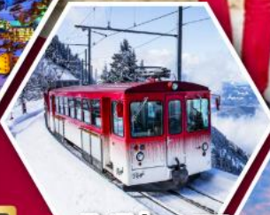
รถไฟใต้เขารัก