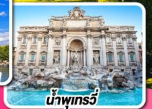
น้ำพุกรวี

04-13 ส.ค. 67 27 ส.ค. 67-05 ม.ค. 68 (ปีใหม่) 28 ส.ค. 67-06 ม.ค. 68 (ปีใหม่) 28 ม.ค.-06 ก.พ. 68