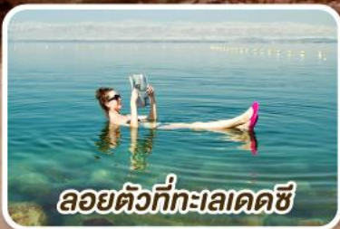
ลอยตัวที่ทะเลเดดซี