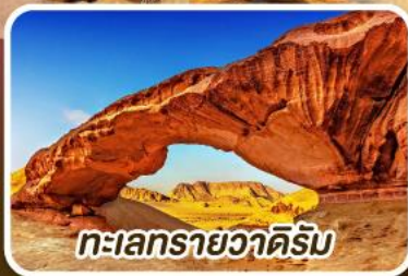
ทะเลทรายวาดีรัม