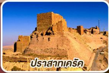
ปราสาทครีค