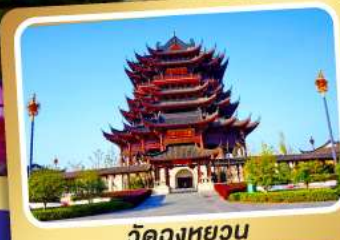
วัดดวงหยวน