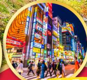
ช้อปปิ้ง ย่านชินจูกุ