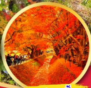
อุโมงค์ใบเมเปิ้ล โมมิจิ โคโร