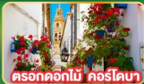
ตรอกดอกไม้ คอร์โดบา

พิเศษ! ชมระบำฟลามิงโก แบบต้นตำหรับจากสเปน