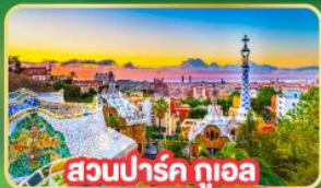
สวนปาร์ค กูเอล