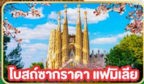
โบสถ์ซาราตา แพมิเลีย

14-23 เม.ย. 68 เดินทาง : 19 - 28 พ.ค. 68