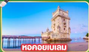
หอคอยเบเลน