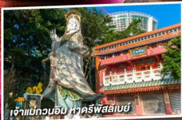
เจ้าแม่กวนอิม หาดริฟส์ลีย์