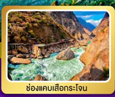
ช่องแคบเสื่อกระโจน