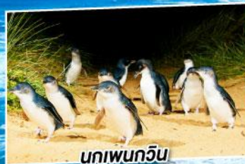
นกเพนกวิน