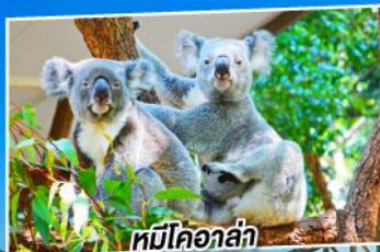
หมีโคอาล่า