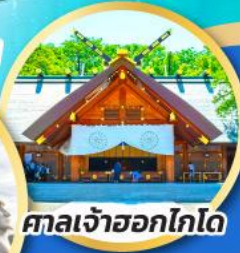
ศาลเจ้าฮอกไกโด