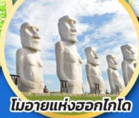
โมอายแห่งฮอกไกโด