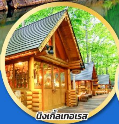
นิงเกิ้ลเทอเรส