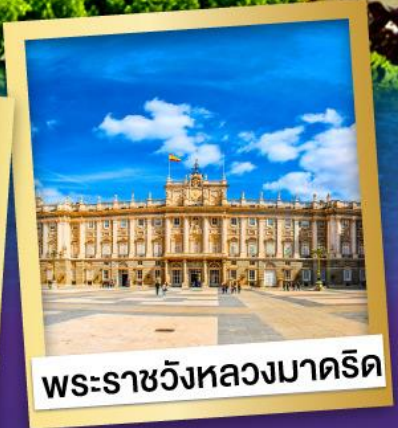
พระราชวังหลวงมาดริด