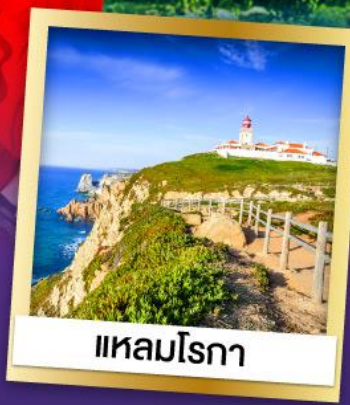
แหลมโรกา